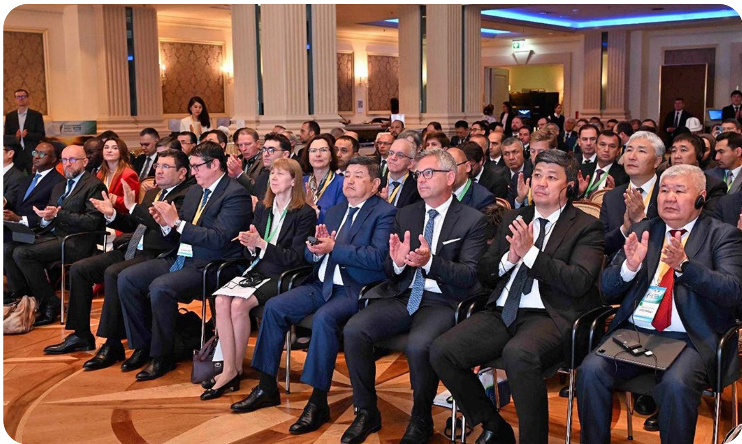
Фото 6. МЭИФ-КР позволил продемонстрировать достижения в реформировании энергетического сектора, обсудить инвестиционные возможности и стратегии ускорения перехода к чистой энергетике, а также пути повышения региональной связанности и совершенствования управления водно-энергетическими ресурсами в странах Центральной Азии. © Всемирный банк. Для использования изображения требуется дополнительное разрешение.