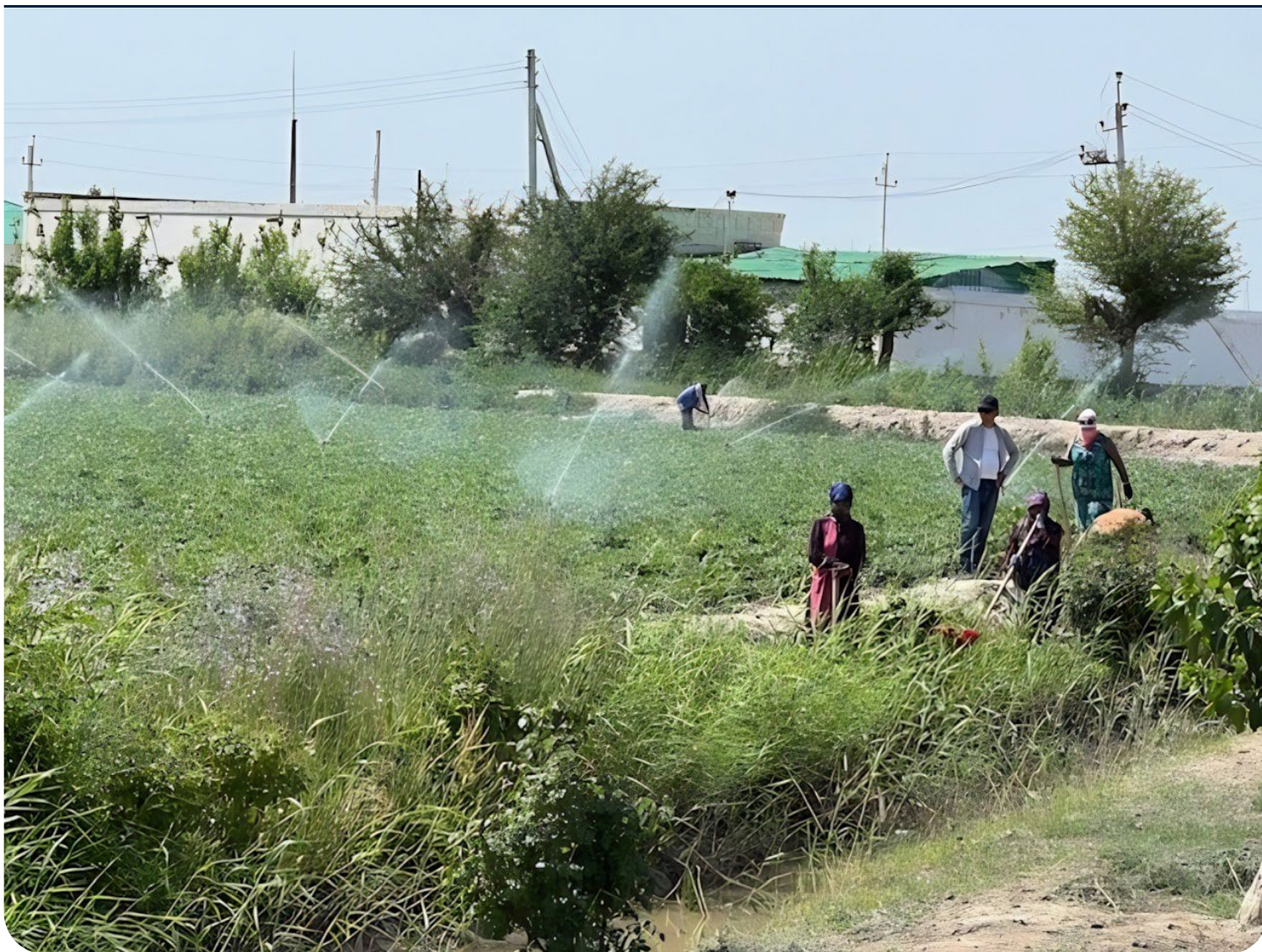
Фото: Схема капельного орошения для выращивания картофеля, используемая в Туркменистане.

Поскольку Центральная Азия сталкивается с нарастающими проблемами, вызываемыми нехваткой воды и изменением климата, CAWEP поддерживает климатическую адаптацию в сельском хозяйстве с помощью проектов, направленных на выявление последствий нехватки воды и разработку практических решений для повышения устойчивости сельского хозяйства в Узбекистане и Туркменистане.