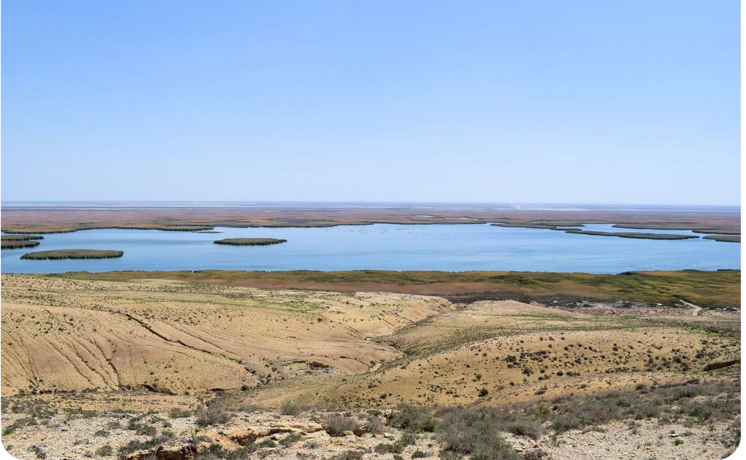
Аральское море

Комплексное водно-энергетическое моделирование бассейна Аральского моря показало, что можно одновременно производить 48 тераватт-часов гидроэлектроэнергии и сельскохозяйственную продукцию на орошаемых землях на сумму 47 миллиардов долларов США в год. Анализ также показал, что достичь этого будет нелегко, поскольку в условиях изменения климата и растущего дефицита воды секторы энергетики и сельского хозяйства конкурируют за воду. Моделирование системы водно-энергетических связей может помочь в планировании ресурсов, показывая вероятные результаты сегодняшних решений в каждой подсистеме для будущего всего бассейна.