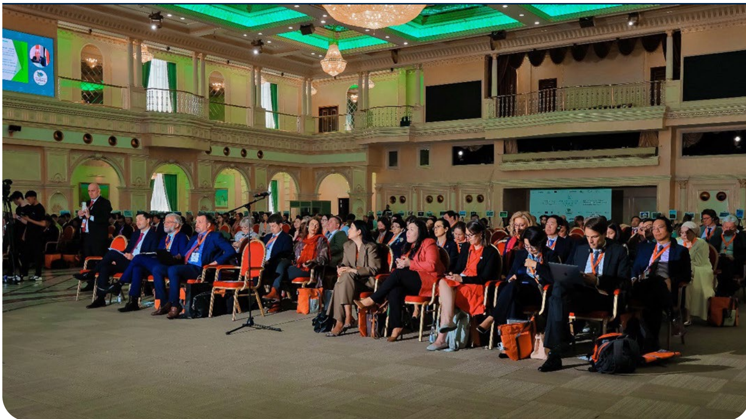
Фото 1. Панельная сессия с экспертами по взаимосвязанности водной, энергетической, продовольственной и экологической безопасности на ЦАКИК-2024. ©CAWEP. Для использования изображения требуется дополнительное разрешение.

Центрально-Азиатская конференция по вопросам изменения климата 2024 года (ЦАКИК-2024) прошла в Алматы 27–29 мая 2024 года и была посвящена важнейшим проблемам, связанным с водной, энергетической и продовольственной безопасностью, а также экологической устойчивостью на фоне изменений климата в Центральной Азии. В конференции приняли участие 400 человек; 320 из них представляли пять стран региона (рисунок 1).