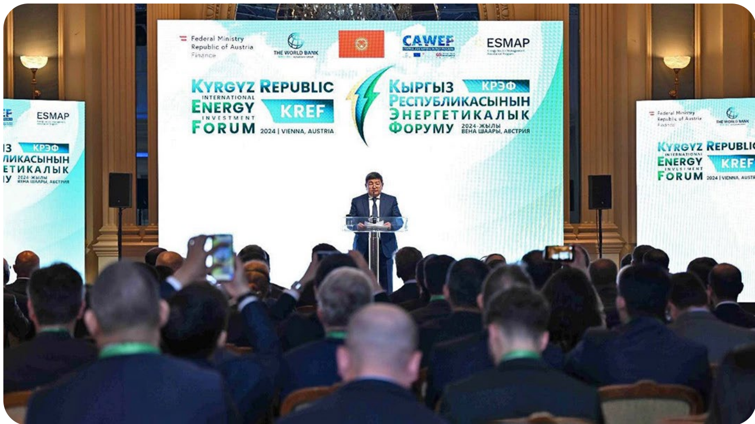
Фото 7. Акылбек Жапаров, премьер-министр Кыргызской Республики, подтвердил твердую приверженность правительства страны курсу на реформирование энергетического сектора и развитие регионального сотрудничества в целях повышения энергетической безопасности, осуществления зеленого перехода и поддержки усилий по достижению национальных целей в области развития. © Всемирный банк. Для использования изображения требуется дополнительное разрешение.

В этом ежеквартальном информационном бюллетене рассказывается о ходе реализации проекта CAWEP-4 и освещаются результаты, которые способствуют развитию регионального сотрудничества в целях повышения устойчивости и интеграции управления водными и энергетическими ресурсами в условиях изменяющегося климата.