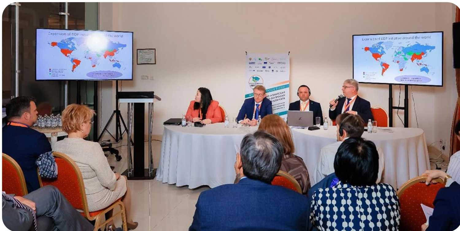
Фото 3. Сессия ЦАКИК-2024. © Валентин Петренко / Всемирный банк. Для использования изображения требуется дополнительное разрешение.

Выступая на сессии по проблемам изменения климата и климатической безопасности, г-н Баур заявил, что Европейский союз заинтересован в стабильности и безопасности в Центральной Азии, и указал на преимущества единых региональных подходов к решению общерегиональных проблем и важность таких региональных платформ, как программа CAWEP, для успешного решения водно-энергетических и климатических проблем в регионе.