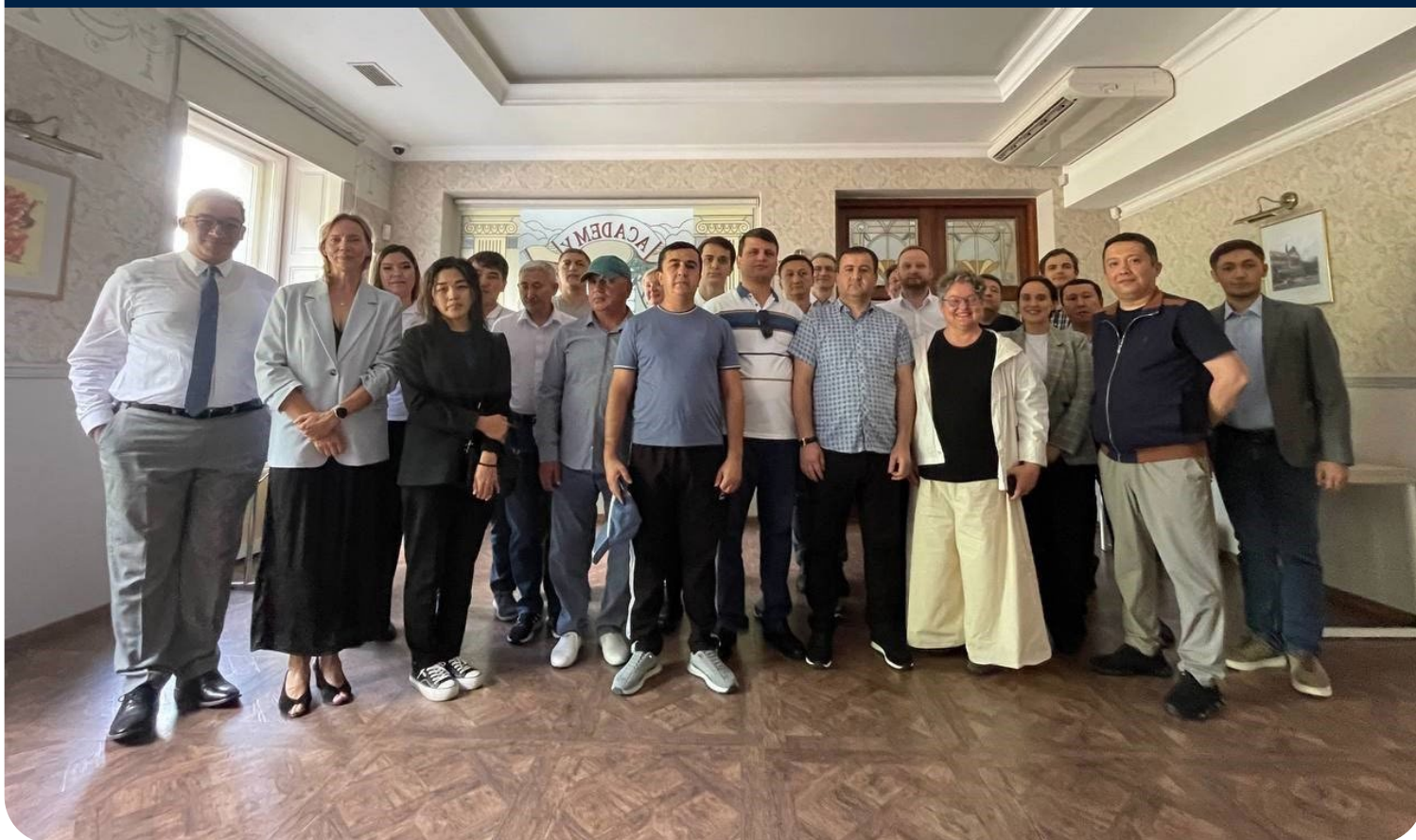
Фото: Участники учебной поездки

По мере того как Центральная Азия сталкивается с нарастающими проблемами, вызванными