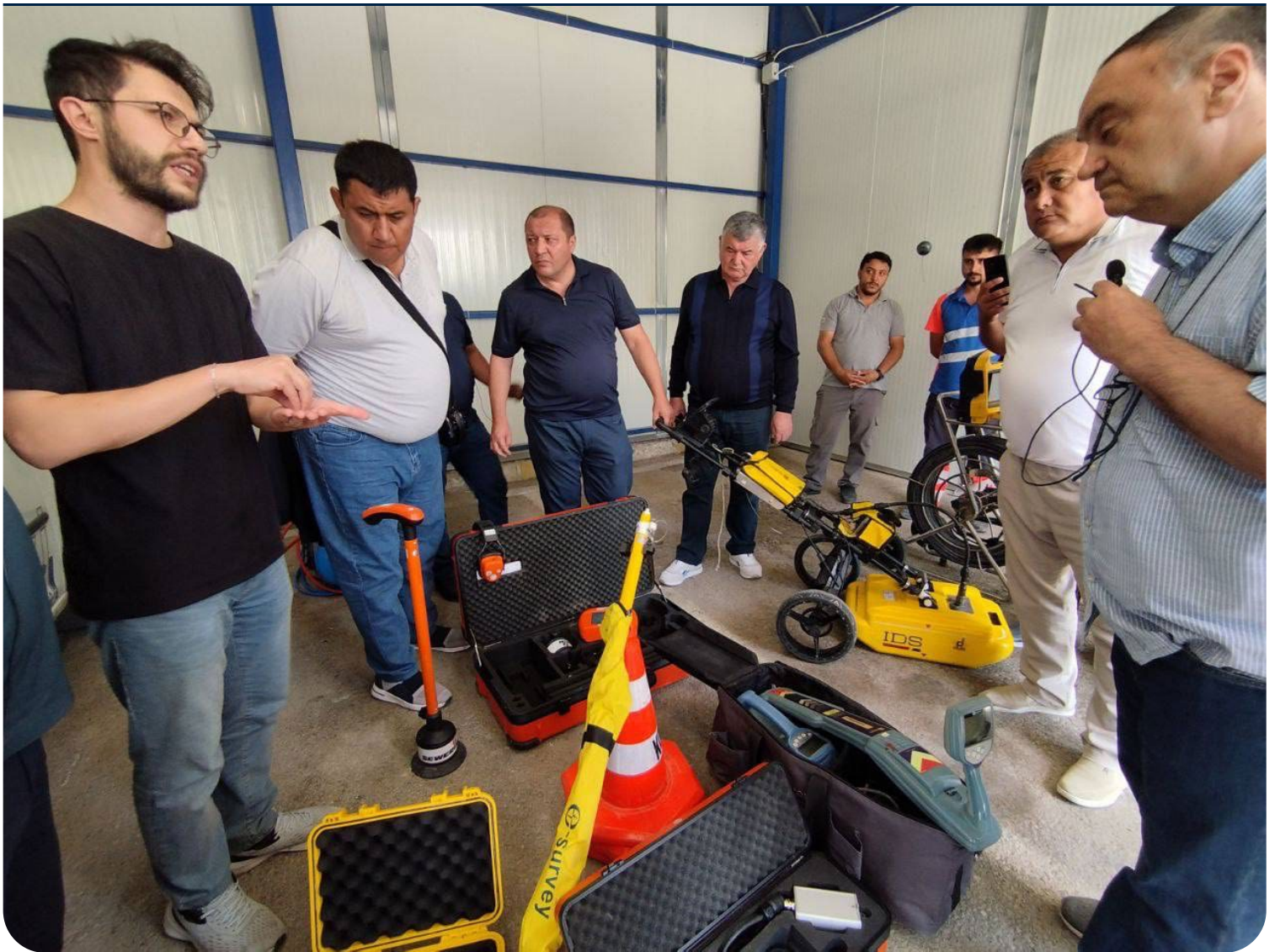
Фото: Специалисты из Узбекистана и Турции обмениваются опытом по энергоэффективности в водоснабжении.

CAWEP продолжает быть ключевым партнером правительств стран Центральной Азии в обеспечении водной и энергетической безопасности в регионе, содействуя развитию сотрудничества и наращиванию кадрового потенциала в водно-энергетическом секторе региона.