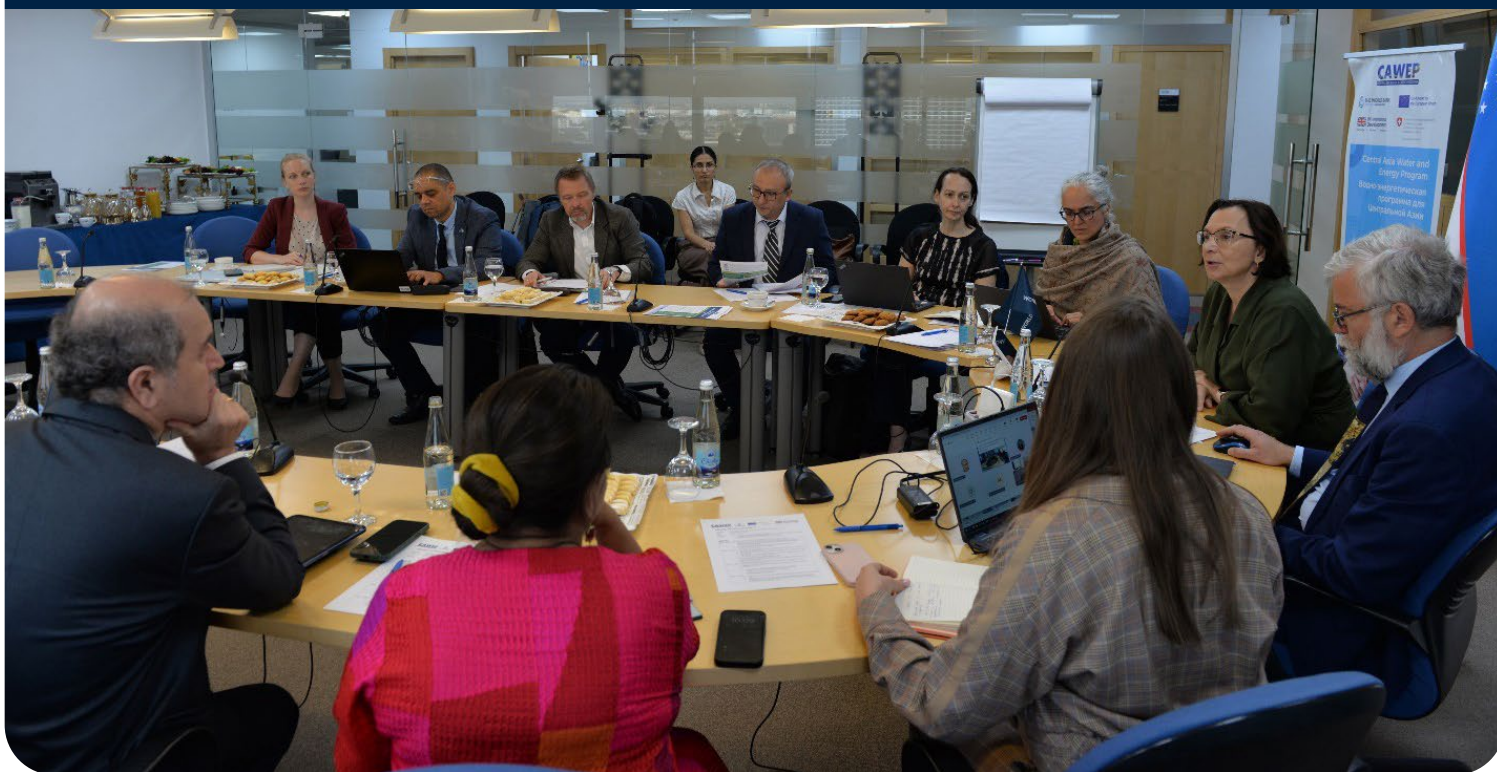
Фото: участники руководящего комитета на заседании в Ташкенте.

В сентябре 2024 года в Ташкенте команда CAWEP провела продуктивную встречу с партнерами по программе – Великобританией, Европейским союзом и Швейцарией – и обсудила с Руководящим комитетом ход реализации четвертого этапа программы и план работы на 2025 год.