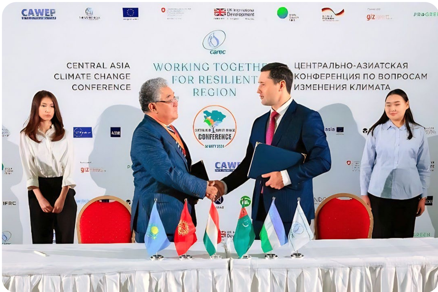
Фото 2. Руководители РЭЦЦА и МФСА подписывают Меморандум о сотрудничестве на конференции ЦАКИК-2024. © Валентин Петренко / Всемирный банк. Для использования изображения требуется дополнительное разрешение.

Участники конференции подчеркнули важность укрепления регионального сотрудничества для успешного решения проблем климата. Объединение усилий совершенно необходимо для устойчивого развития водного хозяйства, возобновляемой энергетики, сельского хозяйства оптимизированного климату, равно как и для привлечения инвестиций в развитие систем раннего оповещения, обмена знаниями, разработки совместных стратегий и совершенствования управления трансграничными водными ресурсами. В целях объединения усилий по решению проблем, связанных с изменением климата в Центральной Азии, Региональный экологический центр Центральной Азии (РЭЦЦА) и Международный фонд спасения Арала (МФСА) подписали Меморандум о сотрудничестве в области рационального управления водными и земельными ресурсами, устойчивого развития энергетики, обеспечения продовольственной безопасности и экологической устойчивости.