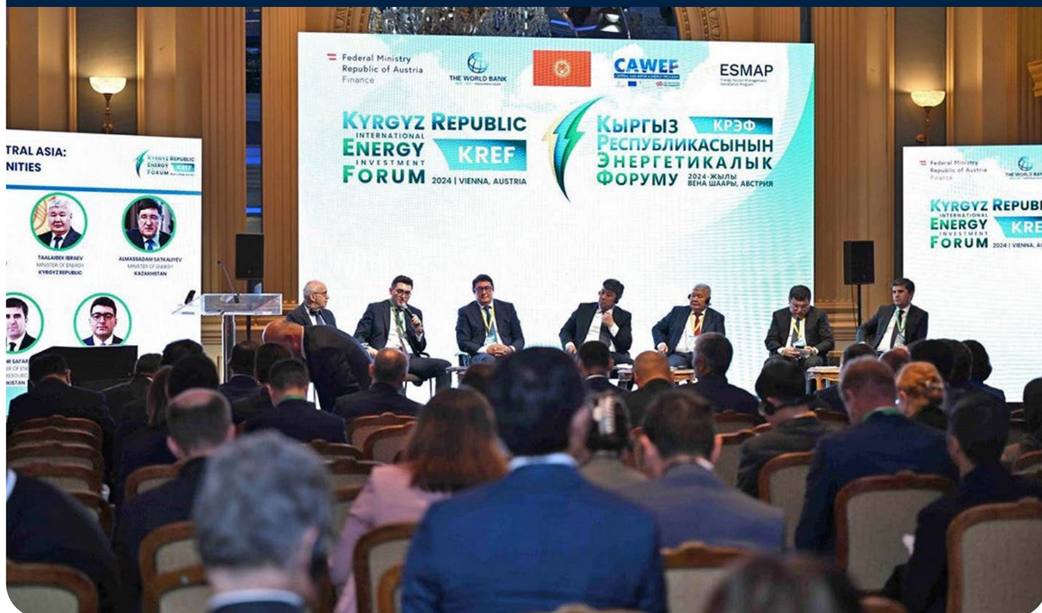
Фото 5. Руководители энергетической отрасли стран Центральной Азии их коллеги из других стран обсуждают стратегии обеспечения водно-энергетической безопасности, ускорения перехода к экологически чистой энергетике и повышения региональной связанности на МЭИФ-КР. © Всемирный банк. Для использования изображения требуется дополнительное разрешение.

Кыргызская Республика готова осуществлять преобразования в сфере энергетики, используя свой огромный потенциал в области гидроэнергетики и солнечной энергетики, для ускорения экономического роста с созданием новых рабочих мест и выхода на нулевой баланс выбросов к 2050 году. Проекты развития экологически чистой энергетики , подготовленные правительством при поддержке CAWEP, обеспечат более чем двукратное увеличение производства энергии в стране, что позволит круглогодично и бесперебойно снабжать электричеством предприятия и домохозяйства, а также